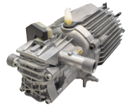
MTP PT 03