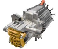
MTP PT 03 Gold