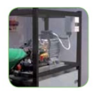
Облегченный доступ ко всем компонентам для удобства обслуживания.