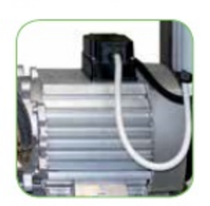
4-хполюсный асинхронный двигатель кат.S1 (постоянной нагрузки) в моделях MLC-C 1310P М и MLC-C 1915P Т. 2-хполюсный асинхронный двигатель кат.S1 (постоянной нагрузки) в модели MLC-C 1813P Т.