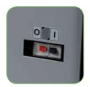
Общий выключатель с термозащитой.