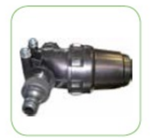
Высокопроизводительный фильтр для воды на входе.