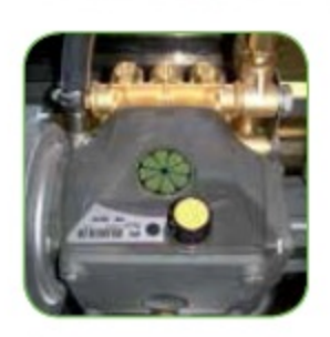
Новый плунжерный насос высокого давления IPC с латунной головкой и тремя керамическими поршнями.